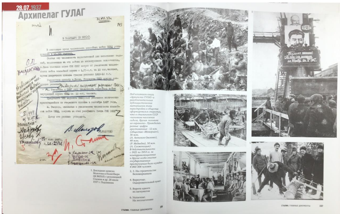
СТАЛИН. ГЛАВНЫЕ ДОКУМЕНТЫ