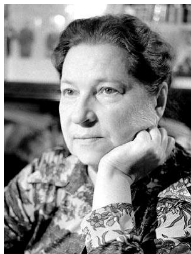
А.Л. Барто Краснодар – 2015